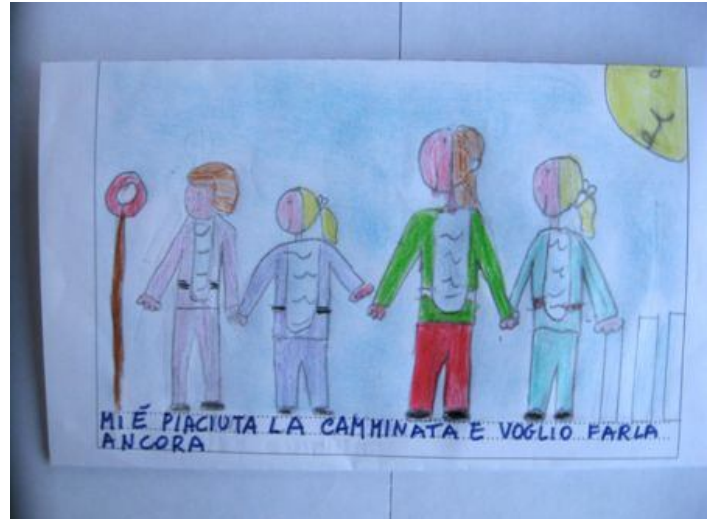
Cosa pensiamo dell'esperienza