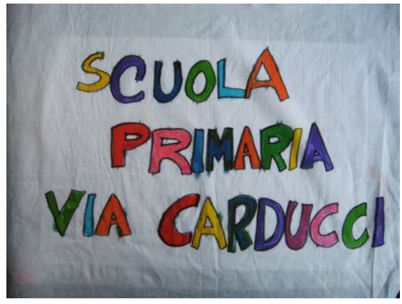
La nostra pettorina